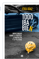
TODO IBA BIEN DÍAZ, ITXU