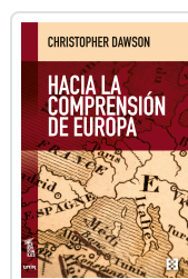
HACIA LA COMPRENSIÓN DE EUROPA DAWSON, CHRISTOPHER