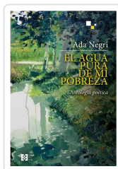
EL AGUA PURA DE MI POBREZA NEGRI, ADA