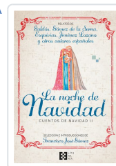
LA NOCHE DE NAVIDAD. CUENTOS DE NAVIDAD II GÓMEZ FERNÁNDEZ, FRANCISCO JOSÉ