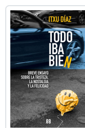
TODO IBA BIEN DÍAZ, ITXU