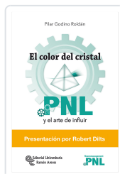
EL COLOR DEL CRISTAL GODINO ROLDÁN, PILAR