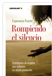
ROMPIENDO EL SILENCIO ESPERANZA PUENTE