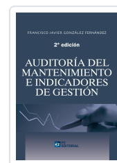
AUDITORÍA DEL MANTENIMIENTO E INDICADORES DE GESTIÓN. 2ª ED. FRANCISCO JAVIER GONZÁLEZ FERNÁNDEZ