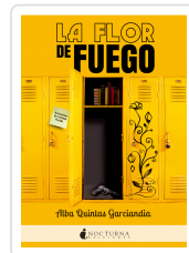
LA FLOR DE FUEGO QUINTAS GARCÍANDIA, ALBA