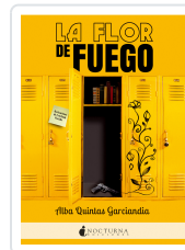
LA FLOR DE FUEGO QUINTAS GARCÍANDIA, ALBA