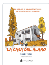
LA CASA DEL ÁLAMO YUMOTO, KAZUMI