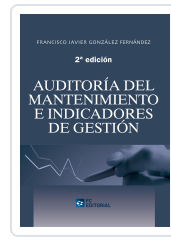
AUDITORÍA DEL MANTENIMIENTO E INDICADORES DE GESTIÓN. 2ª ED. FRANCISCO JAVIER GONZÁLEZ FERNÁNDEZ