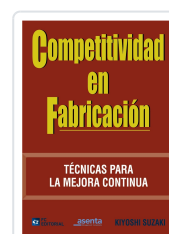
COMPETITIVIDAD EN FABRICACIÓN KIYOSHI SUZAKI