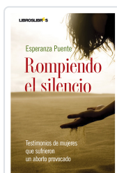
ROMPIENDO EL SILENCIO ESPERANZA PUENTES