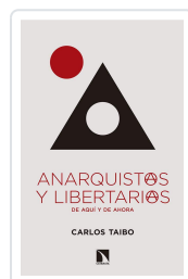
ANARQUISTAS Y LIBERTARIOS DE AHORA Y DE AHORA TAIBO, CARLOS