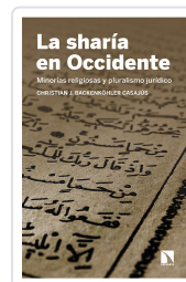
LA SHARÍA EN OCCIDENTE BACKENKÖHLER, CASAJUS, CHRISTIAN J.