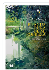
EL AGUA PURA DE MI POBREZA NEGRI, ADA