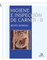
HIGIENE E INSPECCIÓN DE CARNES-II MORENO, B.