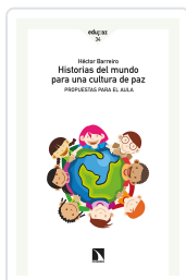
HISTORIAS DEL MUNDO PARA UNA CULTURA DE PAZ BARREIRO, HÉCTOR